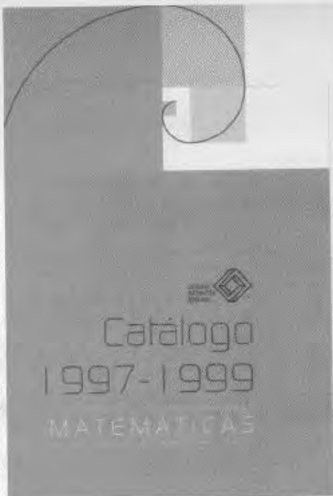
Portada del Catálogo 1997 - 1999

cuántos son de tiempo completo y cuántos de tiempo parcial, así como el nombre de cada uno de ellos; su categoría; su grado académico, institución, disciplina y año en el que lo obtuvo; su tipo de contratación y su dirección electrónica. Se citan, además, las líneas de investigación del programa y las publicaciones editadas en el periodo 1997-1998 y durante 1999. Finalmente, en cuanto a infraestructura, se declara el número de libros de la biblioteca y el equipo de cómputo con que se cuenta.